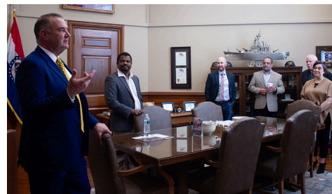
Lt. Governor Mike Kehoe (R-Jefferson City) and members of the Public Policy Committee.